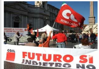
In piazza i lavoratori di Umbria e Marche, Toscana ed Emilia Romagna > Galleria Fotografica